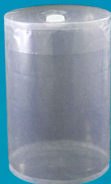
200L口栓付丸底内装袋の実績高く 200L口栓付丸底内装袋 (200Lサイズ=底板0.3× 胴板0.3(0.15×2P)×天板 0.3×直径565×高さ840 (EP付き)mm)