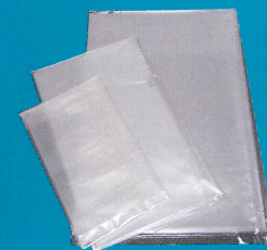
希望サイズでカスタマイズ可能なASOアルミラミネート袋 ASOアルミラミネート袋 (基材構成 ONy(15)/AL(9)/ ONy(15)/LLDPE(60)) ※生産範囲は幅100～850mm、 長さ100～1500mm

滅菌・殺菌処理の重要性を再認識させられる事件や事故が発生し、安全・衛生、品質管理に対する要求が一段と厳しくなっている。化粧品業界も過去に、目の周りに使用する化粧品で緑膿菌が原因とみられる失明事故が発生し、これまで滅菌が必要な化粧品容器および原料は、ガス滅菌(EOG)が多く行われていた。しかし残留ガス、毒性のある副生成物やアレルギーへの懸念が強まり、放射線滅菌が幅広く採用されている。また、食品業界