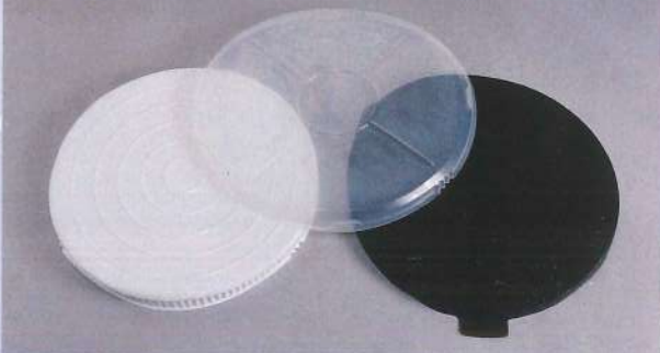
ラベル確認状態(透明タイプのみ)