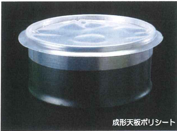
成形天板ポリシート