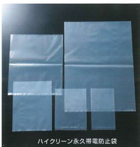
ハイクリーン永久帯電防止袋

弊社「ハイクリーン永久帯電防止袋」は、界面活性剤(有機物)や金属等の練り込みを一切行わない工法(特許出願中)にて製造しております。半永久的に静電防止効果を発揮することができ、さらにブリードアウト(フィルム表面への凝集粉化現象)を抑える事が可能です。