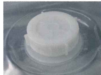
外栓(スクリーキャップ付)